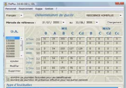
Détermination du quota

Finplus vous est proposé par Corilus, fournisseur de solutions informatiques pour les professions (para)médicales.