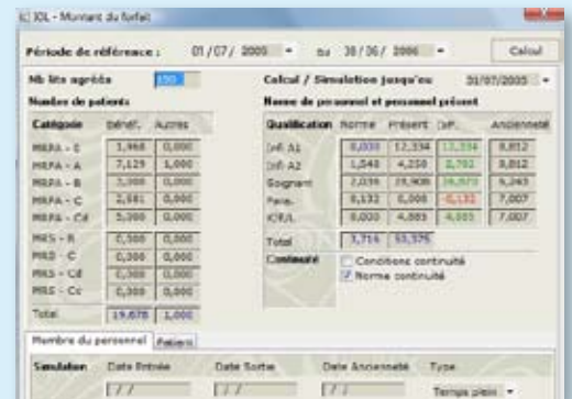
Simulation durant une période de référence