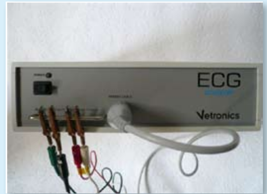
Affichage des données ECG sur écran

Vetronics a choisi Corilus pour distribuer l'ECG sur le marché vétérinaire belge.