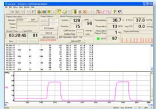
Enregistrement des paramètres