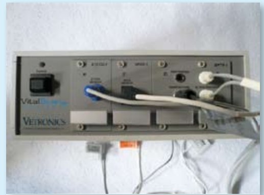
Vitalscan relié à l'ordinateur

Vetronics a choisi Corilus pour distribuer Vitalscan sur le marché vétérinaire belge.